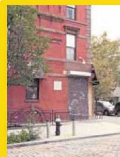
East 118th Street

I el càsting no va ser l'últim combat de Coppola. El rodatge d' El Padrí va ser un camp de batalla continu on es palpava la tensió entre el director i Gordon Willis, el director de fotografia meticulós i lent que treia de polleguera Coppola. Quan els caps de l'estudi van rebre les primeres escenes es van esgarriar. Aquelles