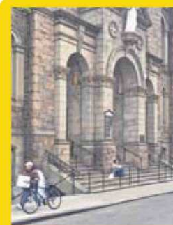
Sant Antoni de Pàdua

Emblema de l'art déco, el Radio City Music Hall fa acte de presència a El Padrí : la Kay surt del cinema quan llegeix l'intent d'assassinat del Don.