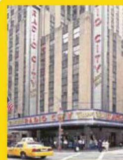
Radio City Music Hall

Abans de ser conegut com a Spanish Harlem, al barri hi vivien sobretot italians. El marit de Connie Corleone hi rep una pallissa brutal.