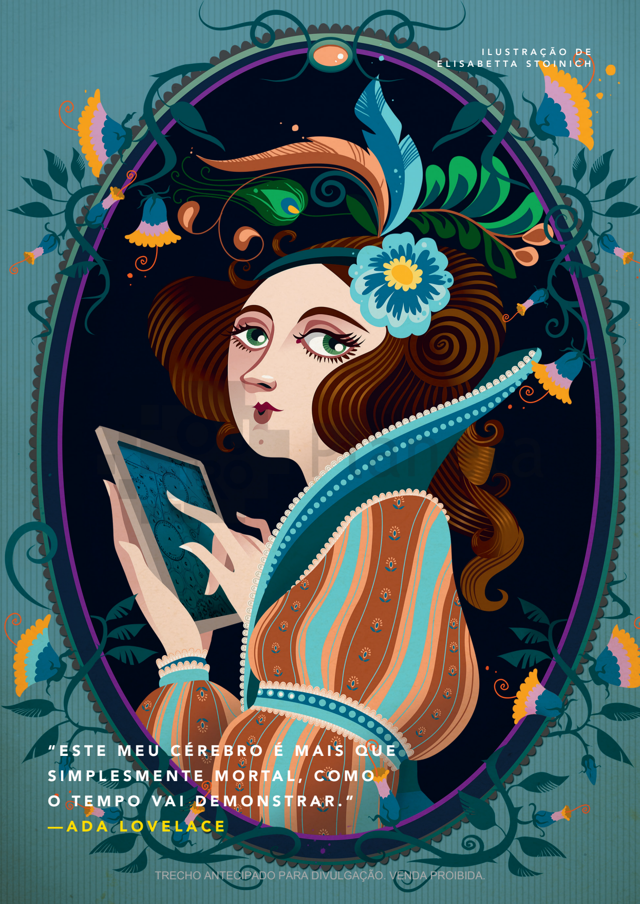
ILUSTRAÇÃO DE ELISABETTA STONICH

"ESTE MEU CÉREBRO É MAIS QUE SIMPLESMENTE MORTAL, COMO O TEMPO VAI DEMONSTRAR."