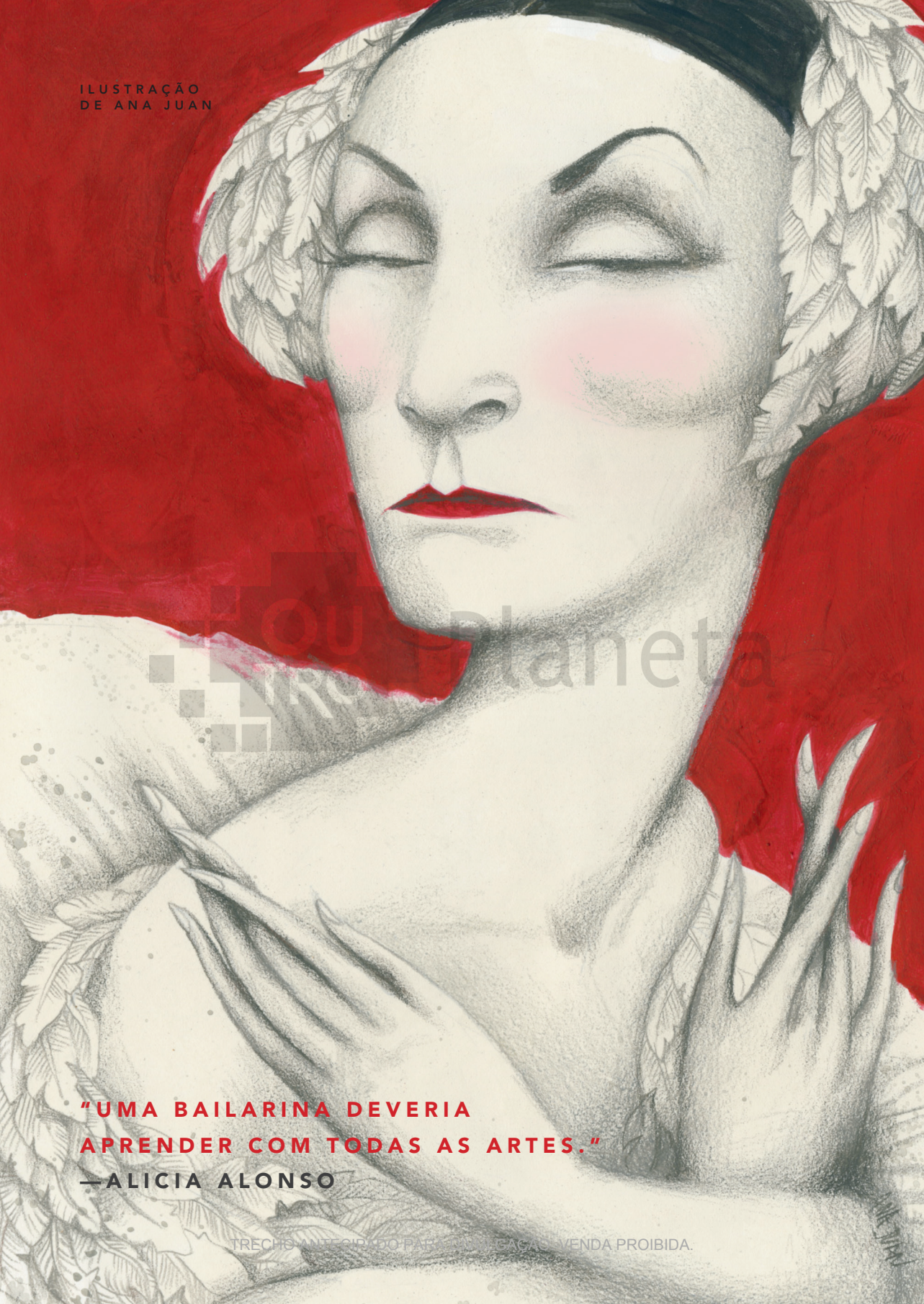
ILUSTRAÇÃO DE ANA JUAN

“UMA BAILARINA DEVERIA APRENDER COM TODAS AS ARTES.”